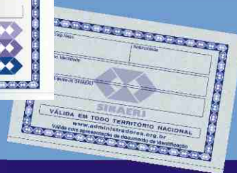
Modelo atual da Carteira Social

Av. 13 de Maio, 13 - 8º - Centro - Rio de Janeiro - RJ CEP 20003-900 - Tel.: (21) 2262-3090 / 2632-2387