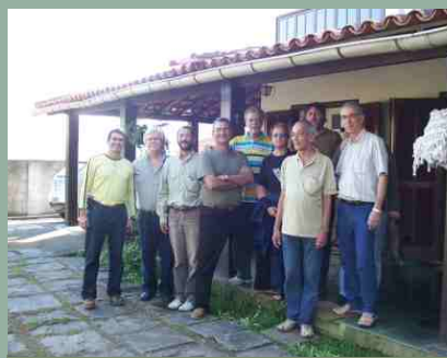
Administradores em Vassouras

Visando estar presente e cumprir o papel de um Sindicato de base estadual, além das visitas regulares que o SINAERJ faz às cidades do interior do Estado, a diretoria passou, desde o ano passado, a fazer reuniões de diretoria nos diversos municípios do Rio. Nestas ocasiões foram focados os problemas locais e tiradas ações e objetivos para a atuação sindical de forma global. A aquisição de um automóvel para o Sindicato também converge numa maior presença na capital e no interior (veja matéria na página 2). Em reuniões passadas, o SINAERJ esteve presente em Barra Mansa, Volta Redonda e Campos dos Goitacazes. A última reunião, ocorrida em julho passado, foi na cidade de Vassouras.