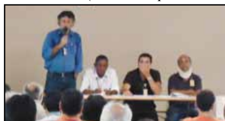
Durante as negociações, o Presidente do SINAERJ defendeu os interesses dos Administradores

Entre as principais conquistas, o acordo permite o aumento de cinco para sete representantes indicados pelos sindicatos, para ocuparem o quadro de membros efetivos do Comitê de Recursos Humanos (CRH) de cada uma das empresas. Para isso, será necessária a ampliação do Comitê para que seja possível incluir mais quatro membros efetivos (dois da empresa e dois