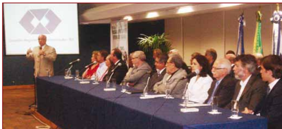
A cerimônia oficial de posse foi realizada no dia 10 de fevereiro com a presença de ilustres Administradores